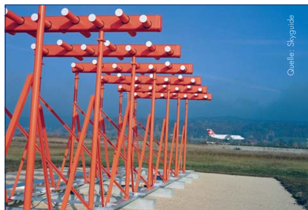
Instrument Landing System (ILS)